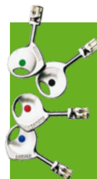
Cylindre 787 Z

Blanc RAL 9010 Marron RAL 8014 Gris RAL 7035 Brut L'intérieur et l'extérieur du vantail peuvent être de teintes différentes